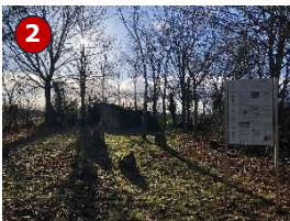
Villa Rustica Hammerstein