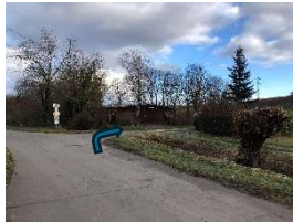
hier rechts abiegen