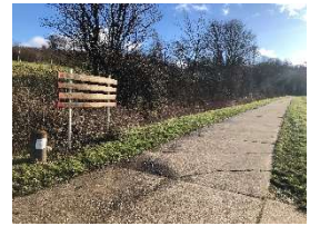
Richtung Villa Rustica