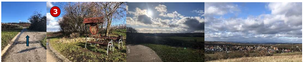
gerade hoch, links zur „Schönen Aussicht“ – Blick Alzey, Donnersberg, Binger Loch, Taunus